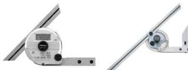
Рисунок 3 – Пример угломеров