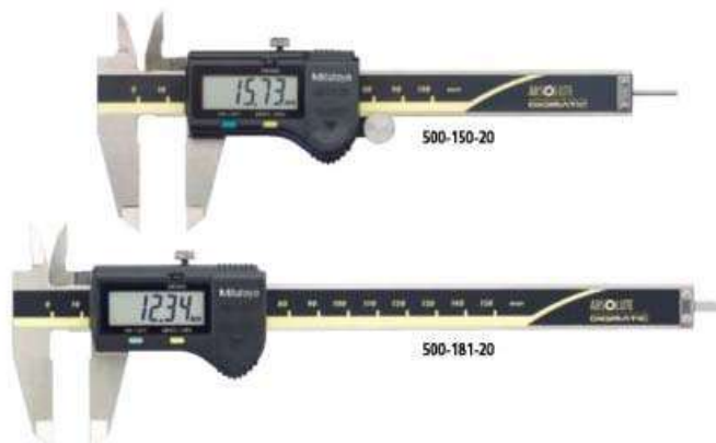
Рисунок 1 – Пример штангенциркулей