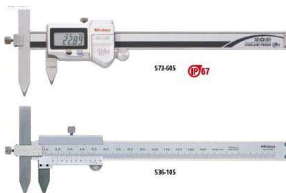
Рисунок 2 – Пример штангенциркулей