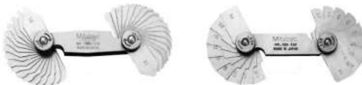
Рисунок 5 – Пример шаблонов для измерений радиусов