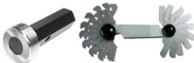
Рисунок 6 – Пример калибр-пробки и резьбомеров